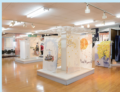
本社内ショールーム