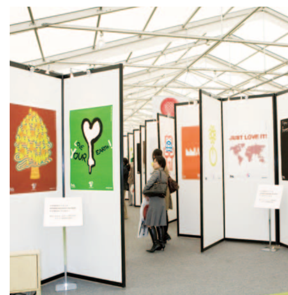
「100% design tokyo」巨大テントに、入選作品100点のポスターが一堂に展示された。

数々のLOVEデザインが東京を席卷した一週間。様々な想いを乗せたデザインは、多くの人々の心に触れた。世界から東京へ。そしてまた世界へと、新たなデザインが発信されていくに違いない。