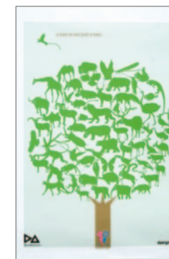
LOVE YOUR EARTH COMPETITION 2nd prize