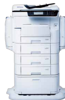
エプソンのスマートチャージ