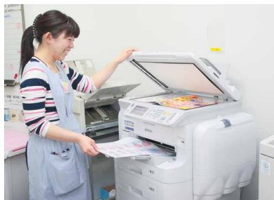
幼稚園職員室に設置された複合機タイプは、原稿スキャンからのカラー教材作成などに活躍