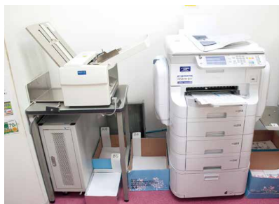
A3複合機フルセットでも職員室スペースにコンパクトに設置

また、ファーストプリントが早いので短い休み時間でもすぐに印刷できる点や、多種多様な紙に対応しているので、子どもたちに渡すカラーイラスト入りの誕生日カードや教材カードなど、先生方の工夫で様々な用途に活用が広がっています。