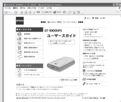
ユーザーズガイド メイン画面